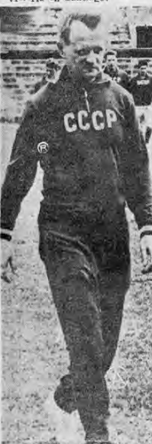
KATCHALIN No conseguimos la meta final, pero en Inglaterra será distinto

por que en nuestro primer partido en noviembre pasado, cuando nuestro equipo obtuvo una victoria en Santiago.