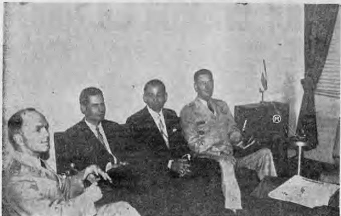
Durante la visita que el Comandante del Ejército de Estados Unidos en el Caribe, Mayor General T. F. Bogart, realizó a nuestro país se lo-